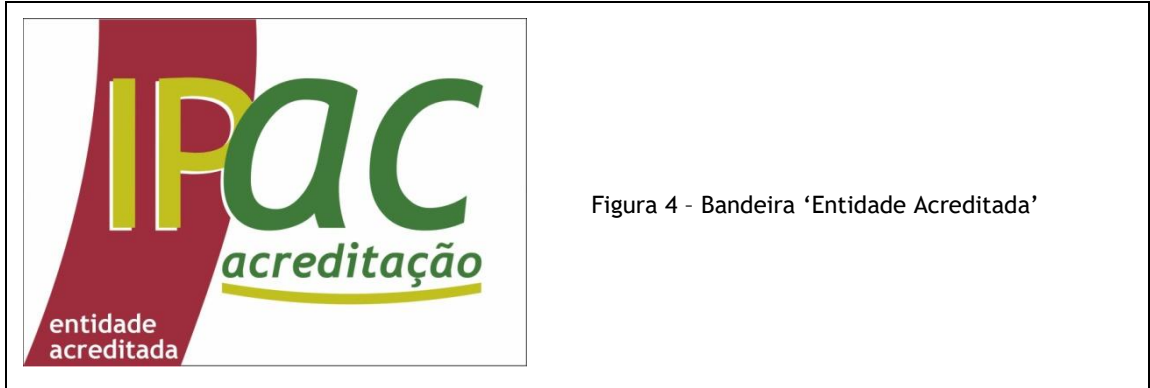
Figura 4 - Bandeira 'Entidade Acreditada'

A Bandeira 'Entidade Acreditada' pode ser colocada no exterior do edifício da entidade acreditada (em local de acesso ao mesmo) ou no interior, em salas de reuniões e salas de espera - pode igualmente ser usada em locais de exposição da entidade acreditada desde que sejam publicitadas atividades acreditadas.